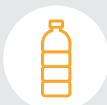
Бутылки от масла