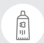
Тюбики от кремов