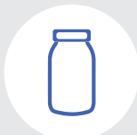
Банки от заквасок