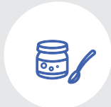
Банки от детского питания

Удалить крышку, этикетку можно не удалять.