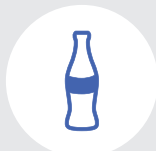
Бутылки от др. напитков