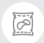
Упаковка от чипсов