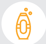
Флаконы от косметики и бытовой химии