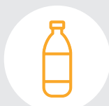
Бутылки от молока