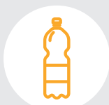
Бутылки от напитков

Эти отходы повезут на дополнительную сортировку и переработку