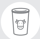
Стаканчики от сметаны, йогуртов