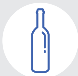
Бутылки от вина

Эти отходы повезут на дополнительную сортировку и переработку